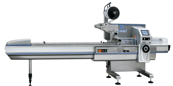
PFM Pearl - Confezionatrice Orizzontale - Horizontal Flowrapper